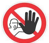
PARC À CONTENEURS