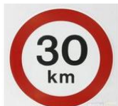
VÍA PÚBLICA PRINCIPAL