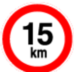
KAI & LAGER